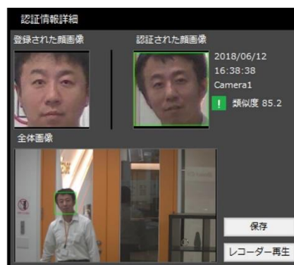
FaceTracker による ダイエット後の顔認証 2018年6月12日