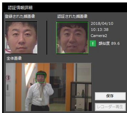
FaceTracker による ダイエット前の顔認証 2018年4月10日